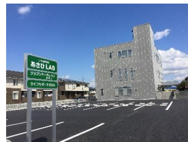
スクーリング会場 ジョブシティカレッジ豊橋校外観 無料駐車場あります